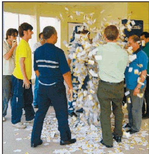
A Câmara de Dirigentes Lojistas de Vacaria sorteou durante o andamento da Promoção Chave de Ouro no ano de 2004 mais de uma centena de prêmios

De 17 a 24 de dezembro foram efetuados os sorteios todos os dias de 20 tortas e 10 poupanças de R$100 reais ao vivo na sede da entidade com membros da diretoria e imprensa local, além da distribuição de mais de uma centena de vale compras de R$ 100,00. O último sorteio ocorrido no dia 29/12, envolvendo 3 prêmios de R$ 500